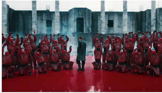
Gambar 3. Ruang Merah dan Struktur Otoritas

Lapisan berikutnya muncul melalui anonimitas dan kolektivitas, sebagaimana ditampilkan pada Gambar 4, terutama pada kehadiran penari bertopeng yang mengelilingi anggota BTS. Penutup wajah, kostum seragam, dan gerak yang sinkron menghapus identitas individu serta mengubah tubuh-tubuh tersebut menjadi satu massa visual. Dalam kerangka ini, figur “hooligan” tidak lagi dibaca sebagai perilaku liar individu semata, tetapi sebagai energi kolektif yang bergerak bersama. Kehadiran kelompok bertopeng ini penting karena mereka memperluas narasi dari ekspresi personal menuju kekuatan bersama. Secara visual, anonimitas justru memperbesar daya simbolik kelompok, sebab fokus tidak lagi terletak pada siapa setiap individu, tetapi pada bagaimana mereka bertindak sebagai satu kesatuan [25].