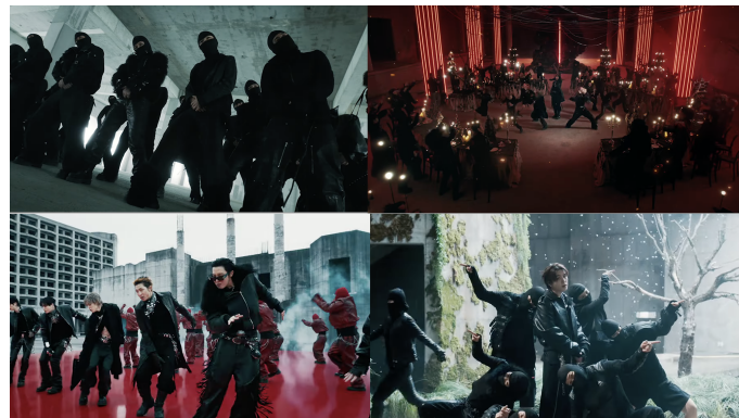
Gambar 10. Koreografi MV

Secara keseluruhan, visual dalam MV “Hooligan” membangun makna melalui relasi erat antara warna, ruang, kostum, setting , tubuh, dan kamera. Gambar 2 menegaskan atmosfer awal berupa tekanan ruang dan kontrol visual. Gambar 3 memperlihatkan ruang merah di hadapan struktur otoritas sebagai simbol energi dan perlawanan. Gambar 4 menampilkan penari bertopeng sebagai bentuk anonimitas dan kolektivitas. Gambar 5 memperlihatkan visual distopia dan limbo yang membangun dunia yang tidak stabil. Gambar 6 menghadirkan figur perempuan sebagai simbol konfrontasi. Gambar 7 menunjukkan dimensi kembali ke akar hip-hop BTS. Gambar 8 menegaskan kostum sebagai pembentuk identitas tubuh yang keras dan tidak konvensional. Gambar 9 menampilkan setting sebagai ruang aktif yang membangun tekanan visual. Sementara itu, Gambar 9 juga menunjukkan bagaimana koreografi dan kamera menerjemahkan perubahan dari chaos menuju kolektivitas. Melalui keseluruhan unsur tersebut, mode visual dalam MV ini tidak hanya berfungsi untuk memperindah lagu, tetapi juga mengembangkan dan mempertegas narasi yang telah dibangun melalui lirik.