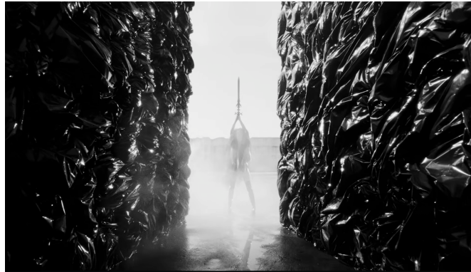
Gambar 6. Figur Perempuan dan Simbol Konfrontasi

Di antara elemen visual tersebut, terdapat pula figur perempuan pada Gambar 6 dengan pedang yang menghadirkan nuansa ancaman, perlindungan, sekaligus ambiguitas simbolik. Kehadirannya memutus alur visual kelompok dan memberikan pusat perhatian baru yang lebih individual. Pedang, tatapan tajam, dan gestur tubuhnya membangun figur yang siap bertarung, sehingga ia dapat dibaca sebagai simbol konfrontasi, perlawanan, atau kekuatan yang berjaga di tengah dunia yang kacau. Karena figur ini tidak dijelaskan secara langsung dalam lirik, maknanya tetap terbuka. Namun, secara visual, ia berfungsi sebagai penanda intensitas dan bahaya yang mempertebal atmosfer naratif MV.