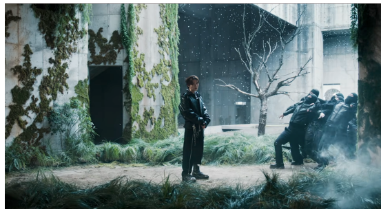
Gambar 5. Visual Distopia dan Limbo

Dimensi visual lain yang kuat adalah konstruksi distopia dan limbo , sebagaimana ditampilkan pada Gambar 5, yang dibangun melalui figur atau objek yang melayang, kabut, pohon gersang, cahaya lilin, kantong hitam, serta ruang-ruang yang terasa kosong namun mengancam. Unsur-unsur ini membentuk dunia yang tampak terputus dari realitas sehari-hari dan berada di ambang kehancuran. Keberadaan tubuh atau benda yang melayang menimbulkan kesan ketidakstabilan dan keterputusan dari gravitasi, sedangkan elemen seperti pohon tanpa daun, cahaya redup, dan benda hitam besar memberi asosiasi pada kematian, stagnasi, atau kehampaan. Dengan demikian, setting dalam MV ini bukan hanya berfungsi sebagai latar tempat, tetapi juga sebagai dunia simbolik yang mendukung tema chaos dan keterasingan.