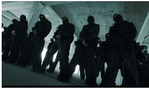
Gambar 4. Penari Bertopeng dan Kolektivitas

Lapisan berikutnya muncul melalui anonimitas dan kolektivitas, sebagaimana ditampilkan pada Gambar 4, terutama pada kehadiran penari bertopeng yang mengelilingi anggota BTS. Penutup wajah, kostum seragam, dan gerak yang sinkron menghapus identitas individu serta mengubah tubuh-tubuh tersebut menjadi satu massa visual. Dalam kerangka ini, figur “hooligan” tidak lagi dibaca sebagai perilaku liar individu semata, tetapi sebagai energi kolektif yang bergerak bersama. Kehadiran kelompok bertopeng ini penting karena mereka memperluas narasi dari ekspresi personal menuju kekuatan bersama. Secara visual, anonimitas justru memperbesar daya simbolik kelompok, sebab fokus tidak lagi terletak pada siapa setiap individu, tetapi pada bagaimana mereka bertindak sebagai satu kesatuan [25].