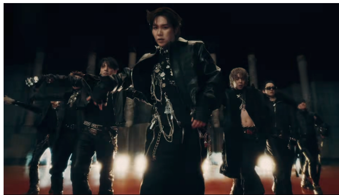
Gambar 7. Kembali ke Akar Visual Hip-Hop

Visual MV ini juga menunjukkan proses kembali ke akar atau reclaiming identity [26], sebagaimana terlihat pada Gambar 7. Meskipun diproduksi dengan skala sinematik yang besar, sejumlah adegan tetap menampilkan gaya busana gelap, koreografi energik, tema jalanan, dan ekspresi tubuh yang agresif yang mengingatkan pada akar hip-hop awal BTS. Oleh karena itu, visual “Hooligan” tidak hanya menampilkan kebaruan, tetapi juga membangun hubungan dengan identitas lama yang kini dihadirkan ulang dalam bentuk yang lebih matang dan monumental. Kesan ini diperkuat oleh perpaduan antara kekasaran visual, gerak yang eksplosif, dan nuansa “ acting a fool again ” yang telah muncul dalam lirik. Dengan demikian, MV ini dapat dibaca sebagai pernyataan kehadiran kembali, bukan dalam bentuk nostalgia pasif, melainkan sebagai energi lama yang diklaim ulang dalam skala yang baru.