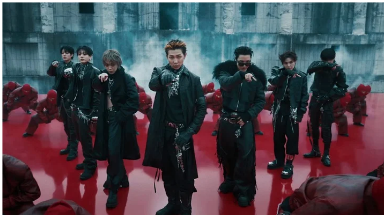
Gambar 8. Kostum MV

Fungsi kostum tersebut semakin jelas ketika dibaca bersama setting pada Gambar 9. Beragam ruang dalam MV ini dikonstruksi melalui elemen industrial, beton ekspos, kolom berulang, rigging , instalasi lampu, lantai reflektif berwarna merah, hingga area yang dipenuhi cahaya lilin atau vegetasi liar. Setting semacam ini menghasilkan dunia visual yang tidak sepenuhnya realistis, melainkan bergerak ke arah urban-distopia . Ruang tampil sebagai elemen aktif yang menciptakan tekanan visual: kadang luas dan kosong, kadang padat oleh massa, cahaya, dan objek. Kontras antara ruang industrial yang kaku dengan area yang lebih organik atau terbuka memperkaya pengalaman visual sekaligus menegaskan bahwa narasi dalam MV ini bergerak di antara kontrol dan ketidakstabilan. Dalam Gambar 9, latar tidak hanya menjadi tempat berlangsungnya aksi, tetapi juga turut membangun rasa chaos , keterasingan, dan energi yang menumpuk.