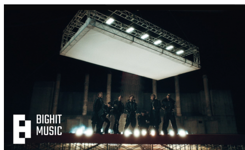
Gambar 2. Thumbnail MV “Hooligan” oleh BTS

Analisis visual diawali dari Gambar 2, yaitu thumbnail MV, yang berfungsi sebagai entry point bagi keseluruhan identitas visual. Dalam gambar tersebut, tubuh para anggota ditempatkan di bagian bawah frame , sementara bagian atas dikuasai oleh struktur ruang industrial dan sumber cahaya yang kuat. Komposisi ini membangun hierarki visual yang menegaskan dominasi ruang terhadap tubuh. Pencahayaan putih terang dari atas dan bawah menciptakan bayangan tegas yang memperkuat suasana dingin, keras, dan terkontrol. Pada saat yang sama, pose tubuh yang stabil dan formasi kelompok yang tetap kohesif menunjukkan keseimbangan antara identitas individu dan kekuatan kolektif. Dengan demikian, Gambar 2 tidak hanya memperkenalkan atmosfer visual MV, tetapi juga menegaskan tema dasar yang akan berkembang selanjutnya, yaitu tekanan ruang, kontrol, dan energi kelompok.