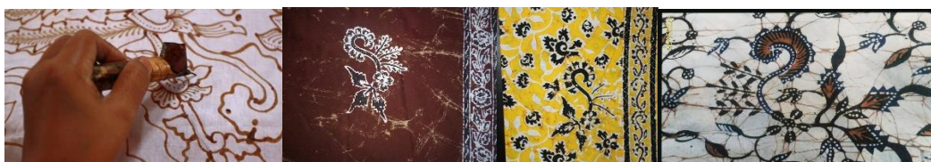
Gambar 2. Salah Satu Produk Batik Tulis, 2016.

batik di kabupaten Banyuwangi sebagian besar merupakan warisan keluarga (mewarisi usaha dan atau belajar membuat batik dari orang tua atau kerabat lainnya). Gambar di bawah adalah salah satu contoh proses menggambar/melukis dengan menggunakan canting dan produk batik.