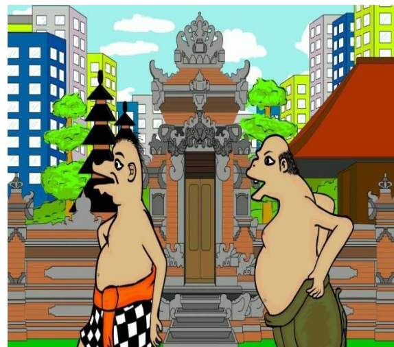
Gambar 2. Animasi dengan pesan keagamaan