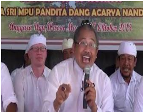
Gambar 3. Video Pencerahan dari orang suci Hindu

Pada media dengan audio visual seperti animasi ini, agar pembelajaran berlangsung dengan baik, maka audiens atau komunikan harus dapat menginternalisasi informasi. Oleh karena hal ini memerlukan kegiatan di mana kedua belah pihak memberikan unpan balik sehingga kesalah pengertian dalam komunikasi dan persamaan persepsi dapat tercipta, maka pada pembelajaran dengan audio visual, partisipasi timbal balik dapat dimunculkan dengan memberikan pertanyaan-pertanyaan yang harus dijawab setelah media ini di berikan untuk memberi informasi seberapa besar pengajaran dapat di serap. Visualisasi media ini di sajikan pada gambar 3.