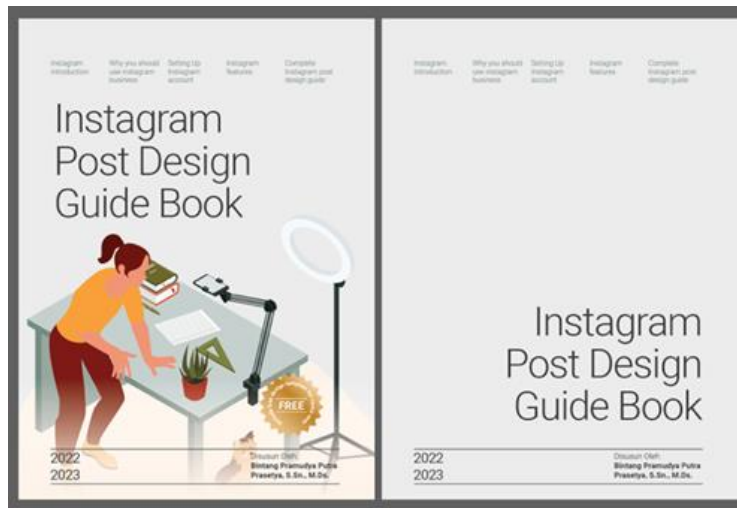
Gambar 2. Layout Cover Depan dan Belakang Buku Instagram Post Design Guide Book

Pada bagian cover depan memuat judul utama yang ditampilkan dengan font Roboto thin berukuran 55 pt berwarna hitam, elemen lain pada cover memuat ilustrasi bergaya flat design yang mengilustrasikan seorang pembuat konten, hal tersebut tertampil pada penggunaan handphone dan ring light pada gambar, selain itu pada cover juga dimuat berbagai bagian dari isi utama sebagai informasi dari konten apa saja yang ada pada buku serta ditambahkan tanda “free template” sebagai pengingat bagi pembaca bahwa pada buku juga terdapat template desain grafis yang akan didapatkan oleh pada pembarunya.