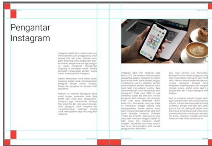
Gambar 4. Layout Isi Buku Instagram Post Design Guide Book

Pada bagian isi, konten terbagi menjadi dua kolom utama, kolom kanan dan kiri, pembeda header dan body text terletak pada perbedaan ukuran, dimana header memiliki ukuran 42 pt dan body text yang berukuran 10 pt, hal tersebut menimbulkan kontas untuk memudahkan pembaca dalam memahami pembagian setiap konten atau chapter . Peletakan gambar pada setiap halaman juga akan berpengaruh kepada kolom yang lainnya, gambar dibuat solid dan tidak mengubah kontur atau susunan body text .