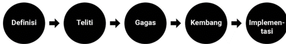
Gambar 1. Tahapan Proses Design Thinking BEKRAF