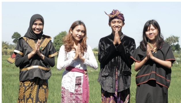
Gambar 3. Potongan Gambar dari Video Promosi DWH Bilebante

penyajian makanan tradisional dan talent dari berbagai latar belakang dimaksudkan untuk menunjukkan keramahan dan kehangatan keluarga. Prinsip pembuatan video seperti ini sesuai dengan penelitian terdahulu yang menekankan perlunya ada kesesuaian antar elemen ketika pemasar memunculkan tagline di dalam video promosinya (Niu et al., 2023). Keberadaan tagline dalam video ini juga agar menguatkan persepsi wisatawan terhadap brand yang diusung oleh DWH Bilebante (Cheema et al., 2016).