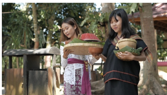
Gambar 2. Adegan penyajian makanan tradisional

Pengambilan footage video dilakukan selama dua hari dengan melibatkan mahasiswa sebagai talent . Pengambilan gambar dilakukan dengan memperhatikan komposisi visual dan pencahayaan yang optimal agar setiap elemen alam dan budaya lokal dapat terlihat dengan jelas dan menarik. Dalam hal ini, talent mengenakan pakaian tradisional seperti lambung yang merupakan pakaian khas Sasak untuk talet wanita, baju godek nongke' untuk talent pria, dan kebaya Bali untuk menunjukkan keberagaman latar belakang masyarakat di DWH Bilebante. Beberapa objek dan kegiatan wisata yang diambil gambarnya adalah Pasar Pancingan, persawahan, kebun herbal, proses penyajian makanan tradisional (lihat Gambar 2), dan aktivitas sehari-hari masyarakat di sekitar objek wisata. Salah satu potongan video yang diambil dapat dilihat pada Gambar 3.