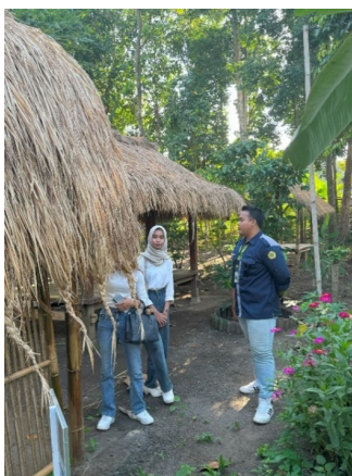
Gambar 1. Observasi di Pasar Pancingan (DWH Bilebante)

Observasi dilakukan bersama tim untuk melihat potensi dan keadaan beberapa objek wisata di DWH Bilebante yang dapat dijadikan sebagai materi promosi. Kegiatan observasi salah satunya ditunjukkan melalui Gambar 1. Observasi ini juga bertujuan untuk mendapatkan pemahaman yang lebih baik dan komprehensif tentang apa yang bisa ditonjolkan dalam materi video promosi yang akan dibuat dan bagaimana cara terbaik untuk menggambarkan daya tarik wisata tersebut. Selama observasi, tim pengabdian melihat langsung kondisi jalan dan objek wisata yang dimiliki oleh DWH Bilebante, seperti Pasar Pancingan, Kebun Herbal, hamparan persawahan hijau, dan keunikan budaya lokal yang bisa dilihat dari makanan tradisional dan keramahan warga sekitar. Tim pengabdian melihat bahwa setiap objek wisata yang dimiliki oleh DWH Bilebante memiliki daya tarik unik yang bisa dijadikan highlight dalam video promosi.