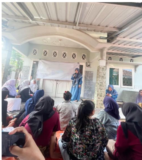
Gambar 1. Penyampaian Materi Kesehatan tentang Sunnah-sunnah Bayi Baru Lahir

Selanjutnya, pada tahap kedua berkaitan dengan kegiatan pendidikan Kesehatan. Pendidikan kesehatan diartikan sebagai suatu upaya kesehatan yang bertujuan untuk menjadikan kesehatan sebagai sesuatu yang bernilai di masyarakat. Pendidikan kesehatan juga dapat menolong dan mendorong individu agar mampu secara mandiri atau berkelompok mengadakan kegiatan dalam upaya mencapai hidup sehat (Notoatmodjo, 2012). Kegiatan ini dilaksanakan dengan pemaparan materi tentang sunnah-sunnah bayi baru lahir dalam Islami dan diskusi atau tanya jawab secara terbuka bersama ibu-ibu peserta. Materi disajikan dalam pemaparan menggunakan media presentasi power-point dan media komunikasi, informasi dan edukasi (KIE) leaflet (gambar 1).