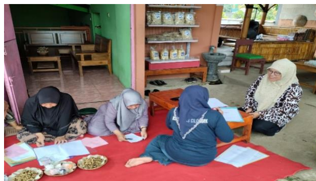
Gambar 3. Peserta Praktik Teknik Membuat Anggaran

Setelah dilakukan praktik peramalan, hasil peramalan digunakan sebagai dasar untuk membuat anggaran penjualan, anggaran produksi dan anggaran kebutuhan bahan baku. Tahap pelatihan penganggaran sedikit mengalami kendala karena kurang pemahannya mereka tentang konsep pembuatan anggaran. Pelatihan pembuatan anggaran sangat terbantu dengan adanya pendampingan oleh mahasiswa.