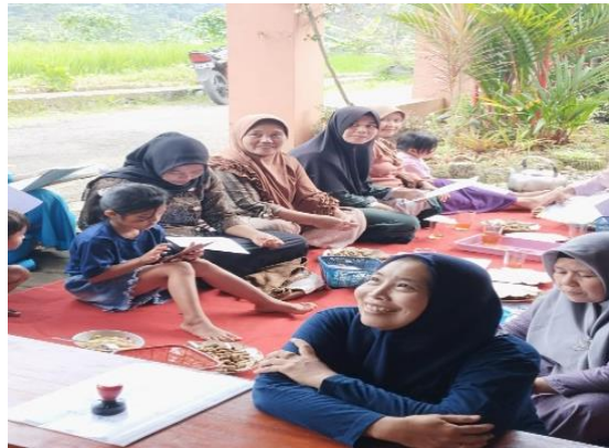
Gambar 2. Peserta sedang mendengarkan penyuluhan

smartphone juga mempercepat pembuatan grafik tren menggunakan metode freehand (Winston, Wayne, 2014).