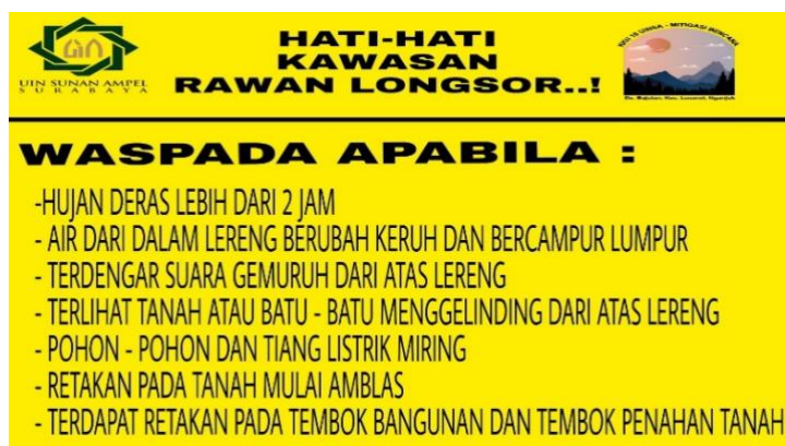
Gambar 5. Rambu Peringatan Bencana Tanah Longsor

Rambu peringatan bencana tanah longsor ini dibuat untuk memberikan peringatan kepada masyarakat dan meningkatkan kesadaran mereka akan ciri-ciri dari Kawasan tanah longsor. Kegiatan ini berdampak positif terhadap perubahan kesadaran dan perilaku masyarakat terkait dengan isu ini.