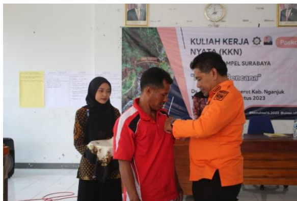
Gambar 4. Pemasangan Pin kepada Relawan Tangguh Bencana

Hal tersebut menumbuhkan motivasi bagi pemuda desa untuk menjadi relawan tangguh bencana. Relawan merupakan orang yang tanpa dibayar menyediakan waktu untuk mencapai tujuan organisasi, dengan tanggung jawab yang besar atau terbatas, tanpa atau dengan sedikit latihan khusus, tetapi dapat pula dengan latihan yang sangat intensif dalam bidang tertentu untuk bekerja sukarela membantu tenaga profesional. Relawan biasanya memiliki beberapa ciri berikut: 1) selalu mencari kesempatan untuk membantu, 2) komitmen diberikan dalam waktu yang relatif lama, 3) memerlukan personal cost yang tinggi, 4) mereka tidak kenal orang yang mereka bantu dan 5) tingkah laku yang dilakukan adalah didasari kerelaan bukan suatu keharusan.