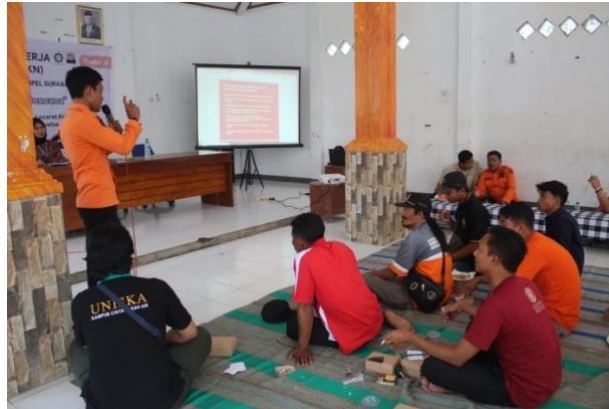
Gambar 3. Proses FGD

Hal tersebut menumbuhkan motivasi bagi pemuda desa untuk menjadi relawan tangguh bencana. Relawan merupakan orang yang tanpa dibayar menyediakan waktu untuk mencapai tujuan organisasi, dengan tanggung jawab yang besar atau terbatas, tanpa atau dengan sedikit latihan khusus, tetapi dapat pula dengan latihan yang sangat intensif dalam bidang tertentu untuk bekerja sukarela membantu tenaga profesional. Relawan biasanya memiliki beberapa ciri berikut: 1) selalu mencari kesempatan untuk membantu, 2) komitmen diberikan dalam waktu yang relatif lama, 3) memerlukan personal cost yang tinggi, 4) mereka tidak kenal orang yang mereka bantu dan 5) tingkah laku yang dilakukan adalah didasari kerelaan bukan suatu keharusan.