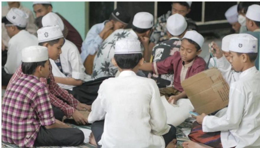
Gambar 2. Dokumentasi Diskusi Kelompok Partisipan

Setiap kelompok mendiskusikan kebutuhan dan keinginan masing-masing anggota kelompok, jumlah uang yang akan ditabung, dan ide investasi atau usaha yang mereka ingin lakukan. Setiap kelompok didampingi oleh anggota tim pengabdian untuk melihat jalannya diskusi dan proses pengambilan keputusan pengelolaan uang mereka. Dalam proses ini, dapat dilihat bagaimana setiap anggota belajar mendiskusikan dan menyampaikan pendapatnya dengan baik serta menghargai pendapat anggota kelompok lainnya.