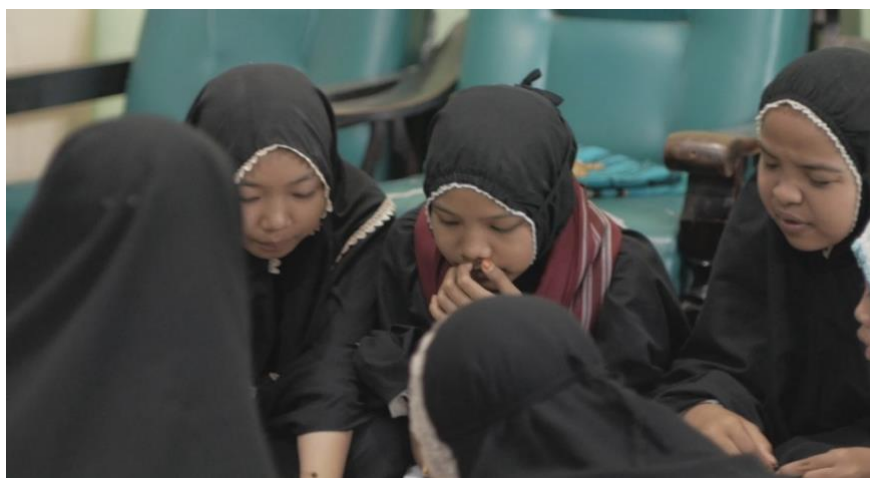
Gambar 3. Dokumentasi Diskusi Kelompok Partisipan

Setelah diskusi selesai dan keputusan diambil, masing-masing kelompok