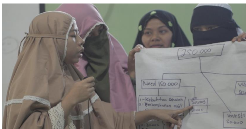
Gambar 5. Presentasi Hasil Diskusi Kelompok

Dengan demikian, maka dapat dikatakan bahwa kegiatan pengabdian ini telah berhasil membuka wawasan para santri dan santriwati ini mengenai pengelolaan keuangan secara bijak ( wise-spend ). Diharapkan para santri-santriwati tersebut dapat menerapkan pengetahuan tentang literasi keuangan dasar ini dalam kehidupan mereka sehari-hari