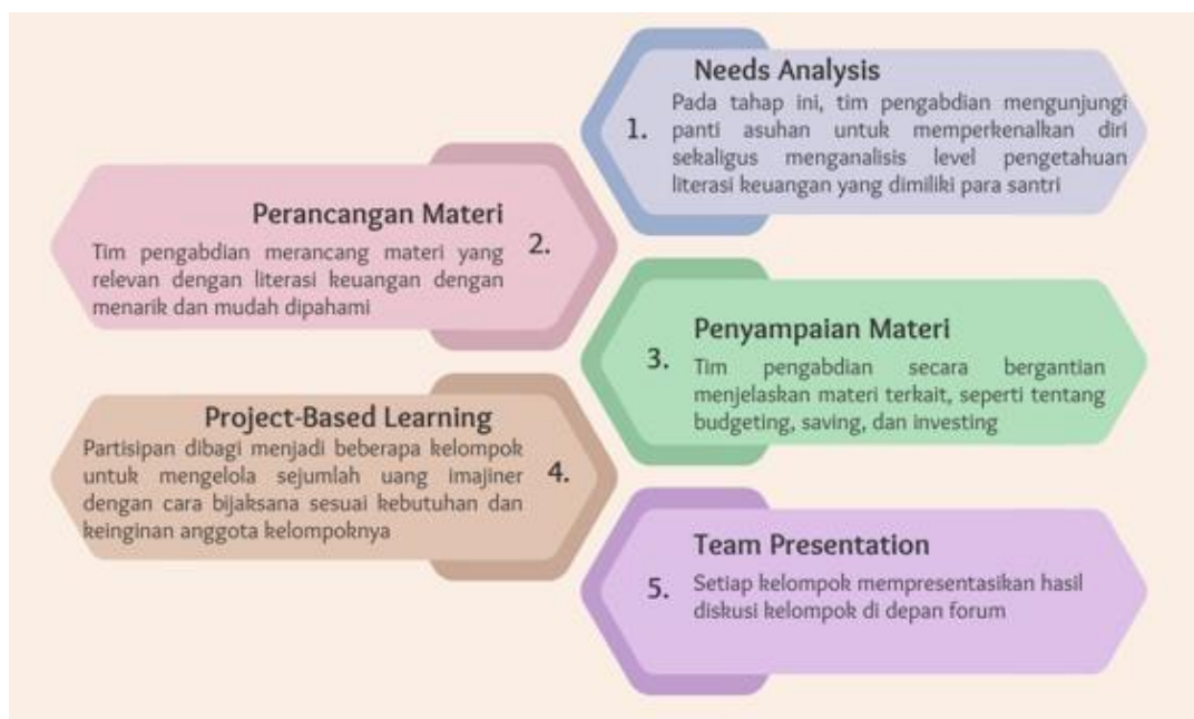
Gambar 1. Alur Pelaksanaan Pengabdian

Selanjutnya setiap kelompok diminta mempresentasikan hasil diskusi kelompok mereka terkait bagaimana mereka melakukan penganggaran ( budgeting ) kebutuhan dan keinginan, jumlah uang yang akan ditabung ( saving ), dan bagaimana kelompok mereka merancang investasi ( investing ) atau ide usaha dari sejumlah uang yang diberikan. Tim pengabdian kemudian melakukan evaluasi terhadap hasil diskusi masing-masing kelompok dan diakhiri dengan pemberian arahan dan simpulan.