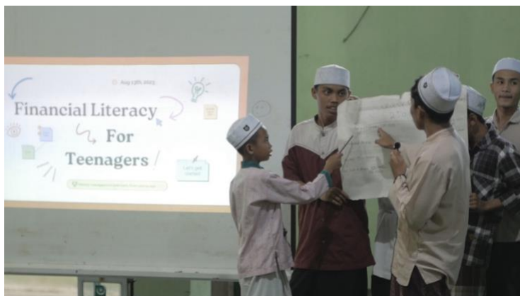
Gambar 6. Presentasi Kelompok

sehingga dapat tercipta generasi muda yang bijak dalam menganggarkan keuangan pribadi mereka. Individu yang sadar akan literacy keuangan adalah orang yang memiliki kemampuan mengelola uang dengan baik dan merencanakan keuangan dengan teratur dan dapat menyisihkan uangnya untuk investasi di masa mendatang (Mireku et al. , 2023). Hal ini juga berkorelasi dengan motivasi dalam berwirasusaha di mana seseorang yang memiliki kemampuan tertentu, dalam hal ini, kemampuan mengatur keuangan memiliki hubungan yang kuat dengan motivasi seseorang menjadi pengusaha (Rapina et al. , 2023).