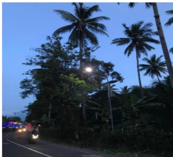
Gambar 12. Penggunaan Lampu Penerangan Berbasis Solar Cell di Malam Hari

Setelah dilakukan pemasangan lampu pada titik-titik yang sudah disepakati, kemudian dilakukan evaluasi berkaitan fungsi lampu sebagai penerangan jalan. Seperti apakah solar cell mampu bekerja dengan baik dalam menyerap cahaya matahari di siang hari serta apakah lampu penerangan berbasis solar cell ini mampu menyala di malam hari seperti yang diharapkan. Berdasarkan hasil pemasangan, lampu dapat menyala dengan cahaya maksimal selama kurang lebih 12 jam terhitung dari pukul 18.00 – 06.00. Sehingga dari hasil evaluasi, didapatkan kesimpulan bahwa lampu penerangan berbasis solar cell dapat bekerja dalam memberikan penerangan yang maksimal di malam hari.