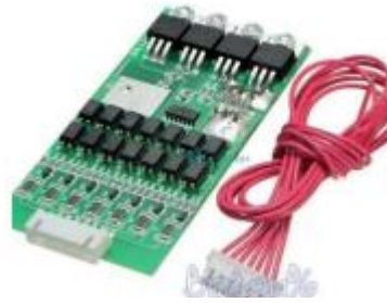
Gambar 3. Battery Management System

BMS ( Battery Management System ) adalah perangkat yang digunakan untuk menyeimbangkan, pemantauan, dan proteksi pada baterai yang disusun secara seri atau paralel. BMS dilengkapi dengan passive cell balancing , sensor tegangan setiap baterai, sensor arus, sensor suhu, rangkaian proteksi untuk memutus arus. Hasil penelitian menunjukkan, BMS mampu membaca nilai tegangan baterai dengan error terbesar 4.59%, nilai arus dengan error 2.002% dan nilai suhu dengan error 0.83%. Passive cell balancing dapat melakukan transfer energi dan \Delta V baterai mengalami penurunan menjadi nilai dari 0.17 V menjadi 0.14 V. Rangkaian proteksi dapat meutus arus saat kondisi overcurrent, overheat, undervoltage, dan overvoltage.