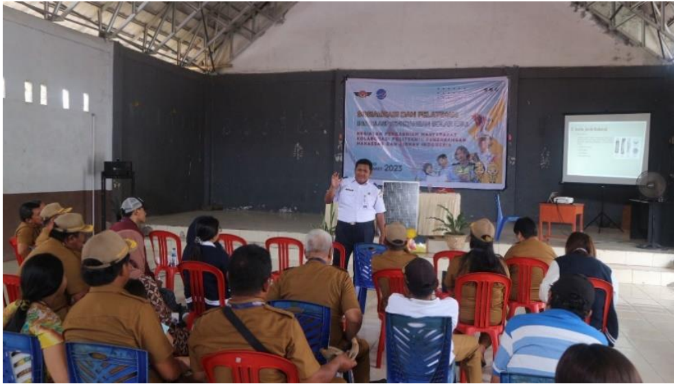
Gambar 6. Kegiatan Sosialisasi dan Pelatihan