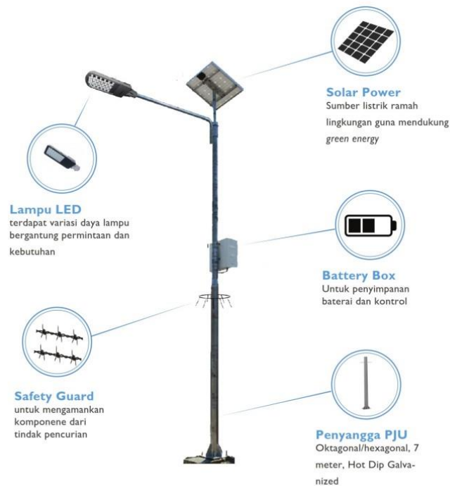
Gambar 8. Komponen Penyusun Lampu Berbasis Solar Cell