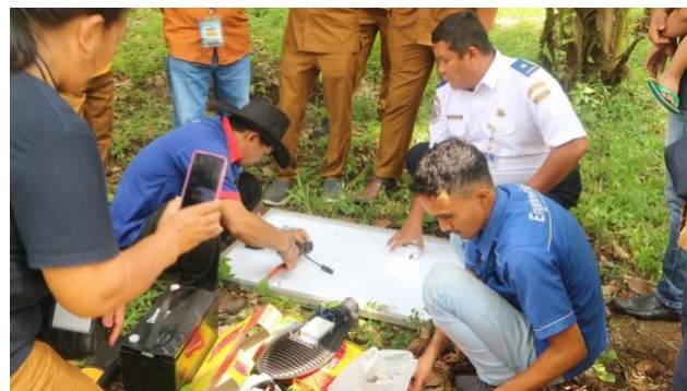
Gambar 10. Instalasi Solar Cell