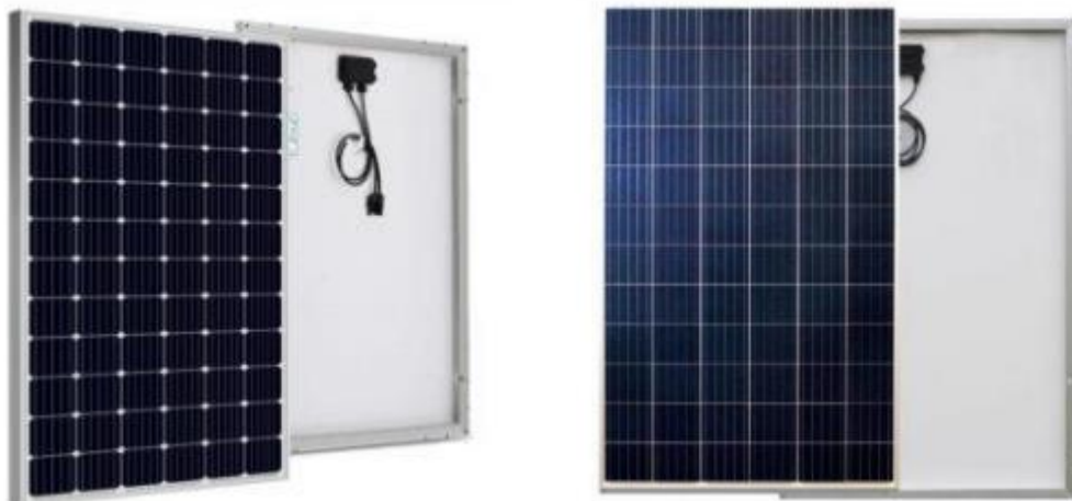
Gambar 1. Solar Cell

Daerah semikonduktor dengan electron bebas ini bersifat negatif dan bertindak sebagai pendonor electron, daerah semikonduktor tipe N(N-type). Sedangkan daerah semikonduktor dengan hole bersifat positif dan bertindak sebagai penerima (Acceptor) elektron yang dinamakan dengan semikonduktor tipe P (P-type). Di persimpangan daerah Positif dan Negatif (PN Junction), akan menimbulkan energi yang mendorong elektron dan hole untuk bergerak ke arah yang berlawanan. Elektron akan bergerak menjauhi daerah Negatif sedangkan Hole akan bergerak menjauhi daerah Positif. Ketika diberikan sebuah beban berupa lampu maupun perangkat listrik lainnya di Persimpangan Positif dan Negatif (PN Junction) hal ini maka akan menimbulkan arus listrik.