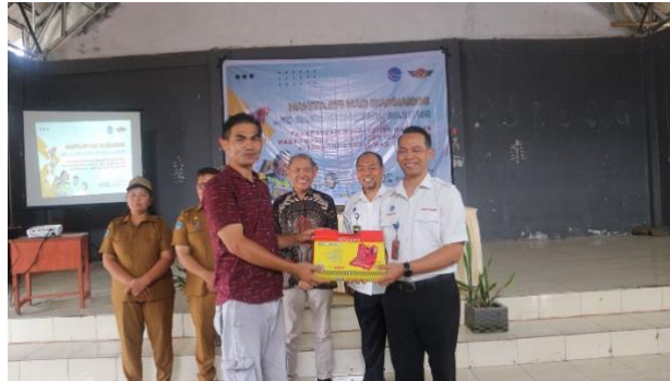
Gambar 9. Penyerahan Peralatan

menyerap sinar matahari sepanjang hari. Selanjutnya semua komponen dihubungkan menggunakan kabel dan konektor. Pemasangan ini harus dalam kondisi yang baik dan tidak ada kebocoran listrik sehingga tidak membahayakan pengguna. Setelah semua komponen terpasang, lampu penerangan jalan umum kemudian diuji untuk dapat dipastikan berfungsi dengan baik.