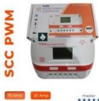
Gambar 2. Solar Charge Controller

Solar Charge Controller adalah peralatan elektronik yang digunakan untuk mengatur arus searah yang diisi ke baterai dan diambil dari baterai ke beban, solar charge controller mengatur overcharging (kelebihan pengisian karena baterai sudah penuh) Solar Charge Controller menerapkan teknologi pulse width modulation (PMW) untuk mengatur fungsi pengisian baterai dan pembebasan arus dari baterai ke beban.