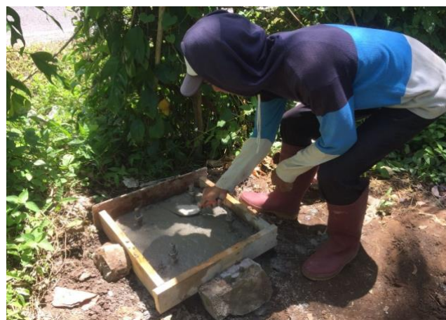
Gambar 11. Pembuatan Pondasi Tiang Lampu