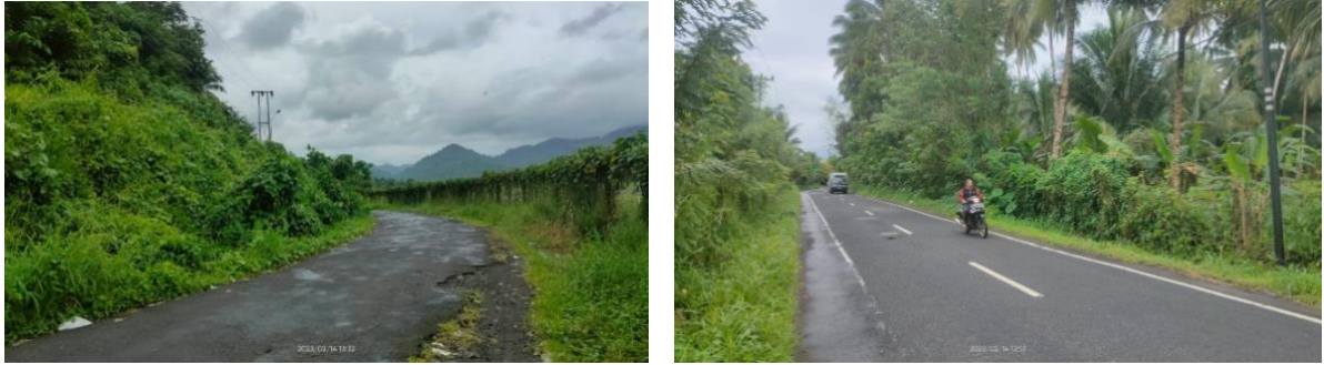
Gambar 5. Titik Peninjauan Pemasangan Lampu Penerangan