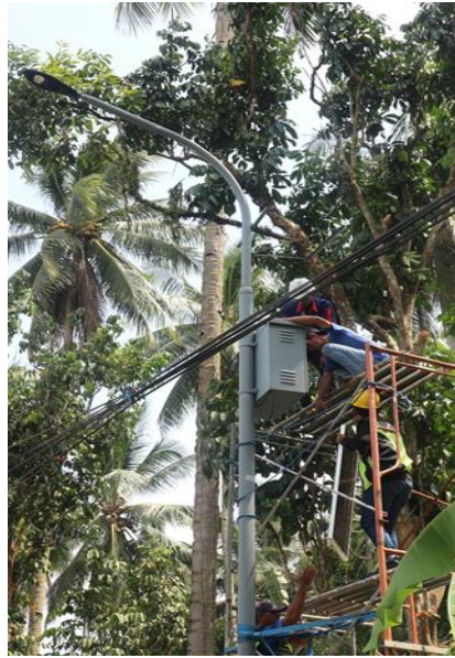
Gambar 12. Pemasangan Lampu Penerangan Jalan