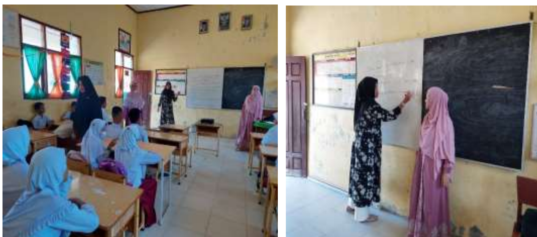
Gambar 2. Kegiatan penyampaian materi yang dilakukan di kelas

Setelah presentasi dilakukan diskusi ringan antara pemateri dengan peserta. Kegiatan sosialisasi tersebut dapat dilihat pada Gambar 2 berikut.