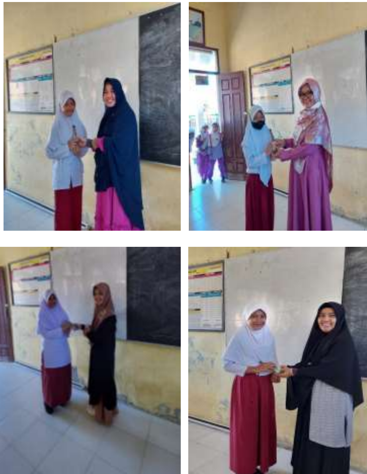
Gambar 4. Pemberian Hadiah ke siswa

Pada Gambar 3 dan Gambar 4 merupakan sesi terakhir dimana pemateri memberikan pertanyaan ke siswa siswi untuk meriview kembali penyampaian pemateri dengan diberikan pertanyaan dan hadiah sebagai penyemangat siswa siswi dikelas.