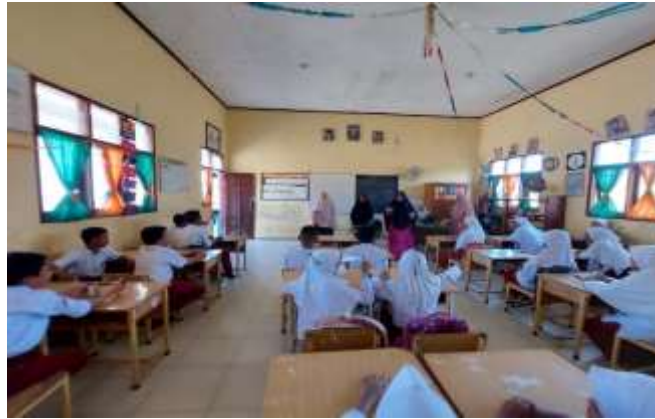
Gambar 3. Sesi penutup dengan memberikan pertanyaan ke siswa di kelas