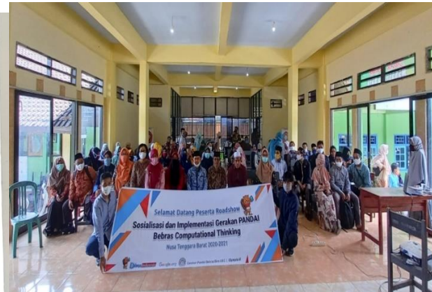
Gambar 3. Kegiatan Sosialisasi