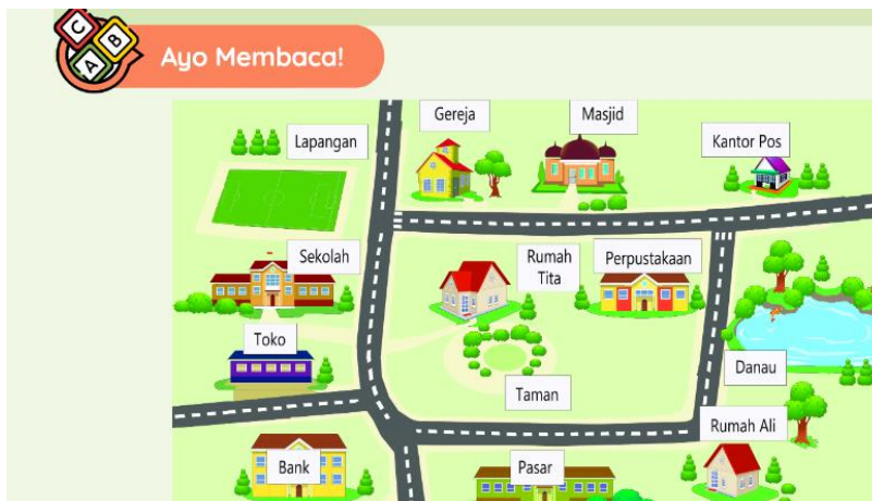
Gambar 2. Soal CT Matematika

Salah satu contoh bagaimana menerapkan atau menginfus computational thinking dalam mata pelajaran matematika dapat dilakukan dengan merancang soal berbasis problem solving sebagai berikut: Jarak rumah Tita ke sekolah 1 Km, sedangkan jarak rumah Ali ke sekolah adalah 3 Km. Waktu yang diperlukan Tita ke sekolah dengan berjalan kaki yaitu selama 10 menit. Jika Ali berangkat ke sekolah pukul 06.00, jam berapa Ali sampai ke sekolah?