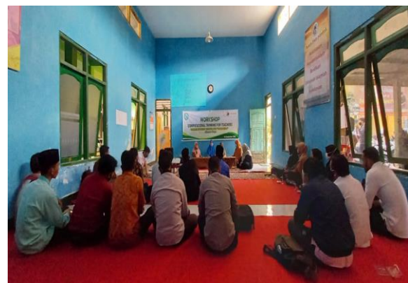
Gambar. 4. Workshop Computational Thinking

Hasil yang diperoleh dari pelatihan/workshop computational thinking adalah peningkatan pengetahuan peserta serta adanya ketertarikan guru dalam menerapkan computational thinking dalam mata pelajaran yang diampunya. Pada akhir kegiatan ini, dilakukan evaluasi dengan menyebarkan kuesioner. Dari pengumpulan data yang dilakukan pada akhir kegiatan dapat diketahui bahwa mitra sasaran (guru) yang sangat memahami Computational thinking sebanyak 59 %, dan guru yang memahami sebanyak 36%. Sedangkan yang kurang memahami sebanyak 3 % dan tidak memahami sebanyak 2 %. Dari hasil tersebut dikimpulkan bahwa sebagian besar peserta dapat mencapai pemahaman materi pelatihan sehingga diharapkan dapat melakukan implementasi atau menginfus compotional thinking