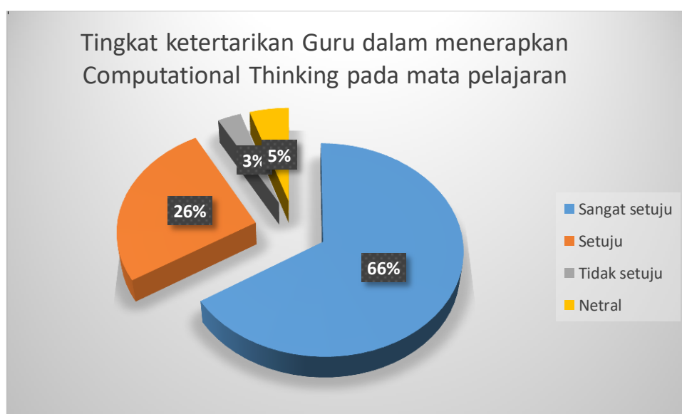
Gambar 6 Tingkat ketertarikan Guru dalam menerapkan Computational Thinking

Sedangkan mitra sasaran yang menyatakan bahwa mereka tertarik untuk menerapkan computational thinking yaitu sebanyak 66% guru menyatakan sangat setuju, dan guru yang menyatakan setuju sebanyak 26%. Sedangkan 3 % guru menyatakan tidak setuju dan sebanyak 5% guru netral. Dari hasil tersebut dapat diketahui bahwa sebagian guru/ mitra sasaran kegiatan pengabdian masyarakat ini menyatakan tertarik untuk menerapkan computational thinking pada mata pelajaran yang diampunya. Ilustrasi dapat dilihat pada gambar 4.